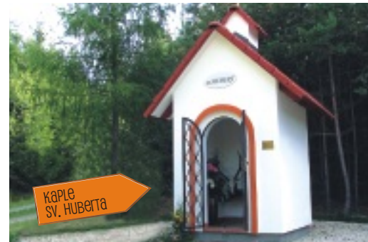
KAPLE SV. HUBERTA

KOŽICH Z odbočky k rybníkům se vrátíte zpět, a pak vystoupáte na vrch Kožich, kde můžete využít rozhlednu , ze které se Vám po zdolání schodů naskytne krásný a daleký výhled – za dobrého počasí můžete vidět nejen Zelenou horu