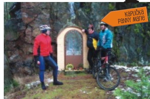
KAPLIČKA PANNY MARIE