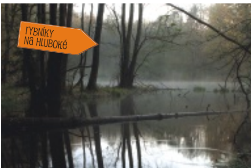
RYBNÍKY NA HLUBOKÉ